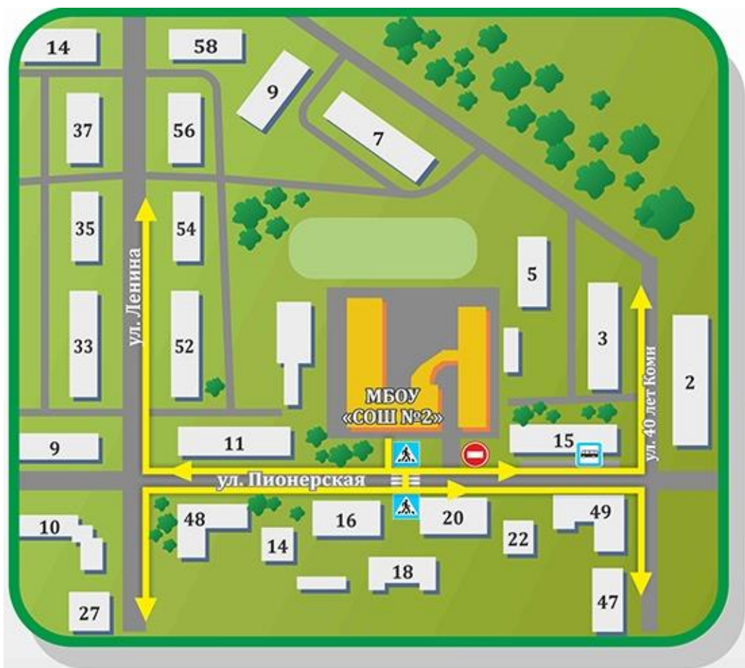
Схема организации дорожного движения в непосредственной близости от образовательного учреждения с размещением соответствующих технических средств, маршруты движения обучающихся